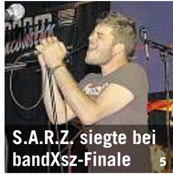
S.A.R.Z. siegte bei bandXsz-Finale 5

Bote der Urschweiz Schmiedgasse 7, 6431 Schwyz www.bote.ch Redaktion: Fon 041 819 08 11 Fax 041 811 70 37 redaktion@bote.ch Abonnemente: Fon 041 819 08 09 Fax 041 819 08 53 abo@bote.ch Inserate/Anzeigen: Fon 041 819 08 08 Fax 041 819 08 17 inserate@bote.ch