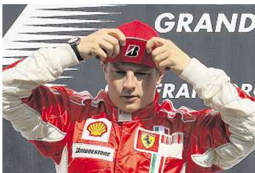
Sieg für den «Ausserschwyzer»: Der in Wollerau wohnhafte Finne Kimi Räikkönen gewann nach den Turbulenzen dieser Woche vor Felipe Massa.

Automobil. – Der finnische Ferrari-Fahrer fuhr beim Grossen Preis von Belgien einen ungefährdeten Start-Ziel-Triumph heraus. Felipe Massa machte als Zweiter den dritten Doppelerfolg für Ferrari in diesem Jahr perfekt. Für McLaren-Mercedes endete das Rennen vier Tage nach dem juristischen K.o. in der Spionage-Affäre mit einer sportlichen Niederlage. Der zweifache Champion Fernando Alonso machte als Dritter aber einen Punkt auf seinen Teamkollegen und WM-Spitzenreiter Lewis Hamilton gut. (si) SEITE 22