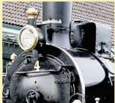
Sanierung gelungen: Die «Schwyz» fährt wieder.