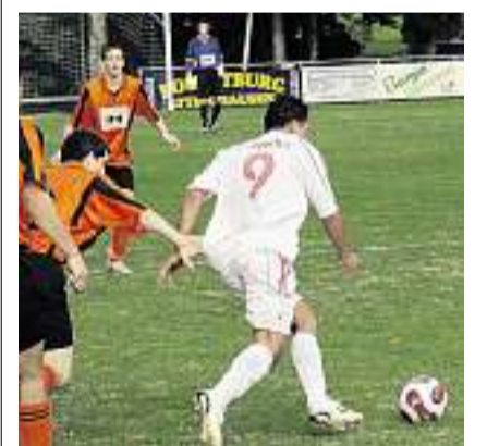
Auch der FC Brunnen gewann: Die Kurortler besiegten die Reserven von Schattdorf mit 2:0.