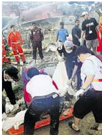
Bergung der Opfer: Für zwei Drittel der Passagiere kam jede Hilfe zu spät.

Phuket. – Die thailändische Maschine war gestern Sonntag von Bangkok aus auf die Ferieninsel geflogen. Bei der Landung auf dem Flughafen Phuket rutschte sie von der Rollbahn und brach auseinander. Dabei sind gemäss bisherigen Angaben 87 Menschen getötet und 43 weitere verletzt worden. Unter den Passagieren befanden sich viele ausländische Touristen, vor allem auch Briten. Mindestens fünf Deutsche wurden verletzt. Schweizer befanden sich laut EDA nach bisherigen Kenntnissen nicht an Bord. Ge-