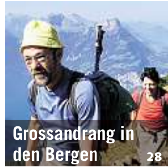
Grossandrang in den Bergen 28